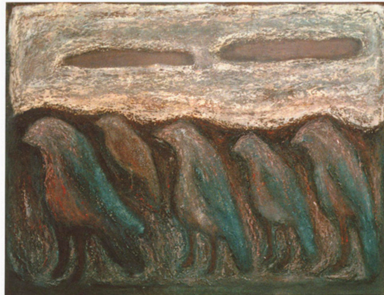
«СПЯЩИЕ ПТИЦЫ». ХОЛСТ, МАСЛО, 1987. СОБСТВЕННОСТЬ АВТОРА

Но превратится ли увлечение в продукт? Не знаю. Снимать кино увлекательно, но, прежде всего, я художник.