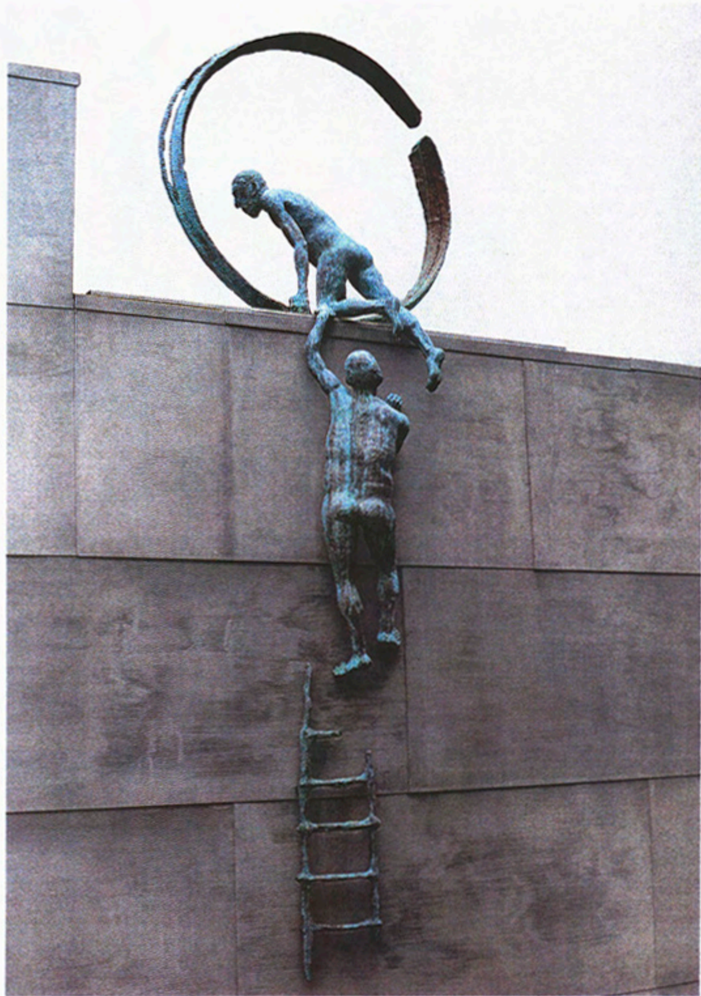
Восхождение. 2004. Бронза. 36,5x1,50x65