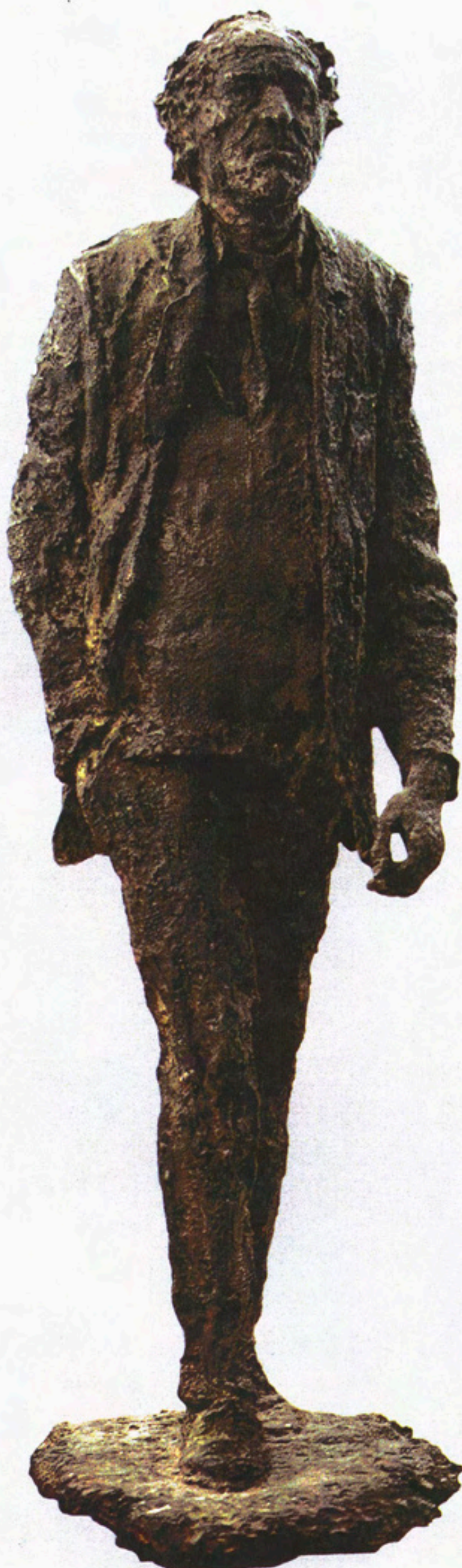
Бронзовый. 2002. Бронза. 70x30x19