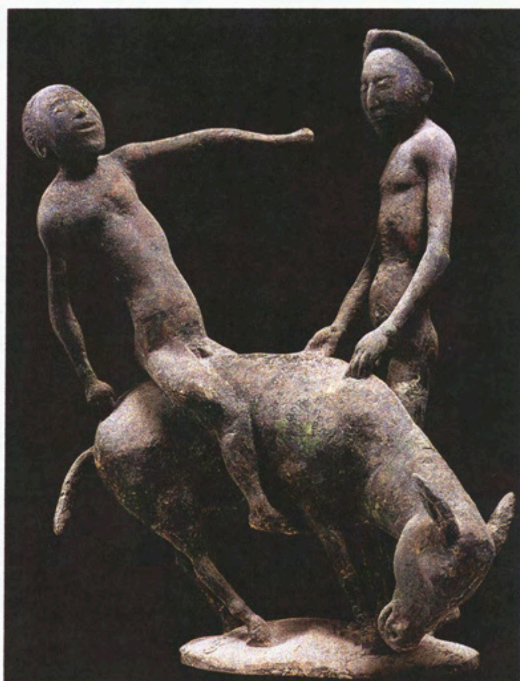
Мальчик на ослике. 1981. Гипс. 55x40x22

Для Владимира Соскиева очень важно, что он — осетинский скульптор. Это не значит, что его творчество каким-то образом отгорожено от русского и интернационального контекста. Ничего подобного. Художественный язык, эстетика Соскиева универсальны и потому общепонятны. Это современный художник. И в то же время его произведения соотносятся с искусством историческим. В XX веке примеры подобной соразмерности истории, «корням» дали многие мастера. В их числе итальянец Марино Марини, неоклассическое довоенное творчество которого восходит к этрусской пластике, и англичанин Генри Мур, искавший вдохновение в неолитических артефактах древних западноевропейцев. Профессиональное образование Соскиев получил в русском художественном училище в Ордженикидзе (1959–1964), Суриковский институт в Москве (1967–1971). Однако самыми важными стали для него идеи модернизма, с которыми в советское время можно было познакомиться лишь через книги. И все эти приобретённые знания накладывались на чувство национальной принадлежности, знание истории своего народа.