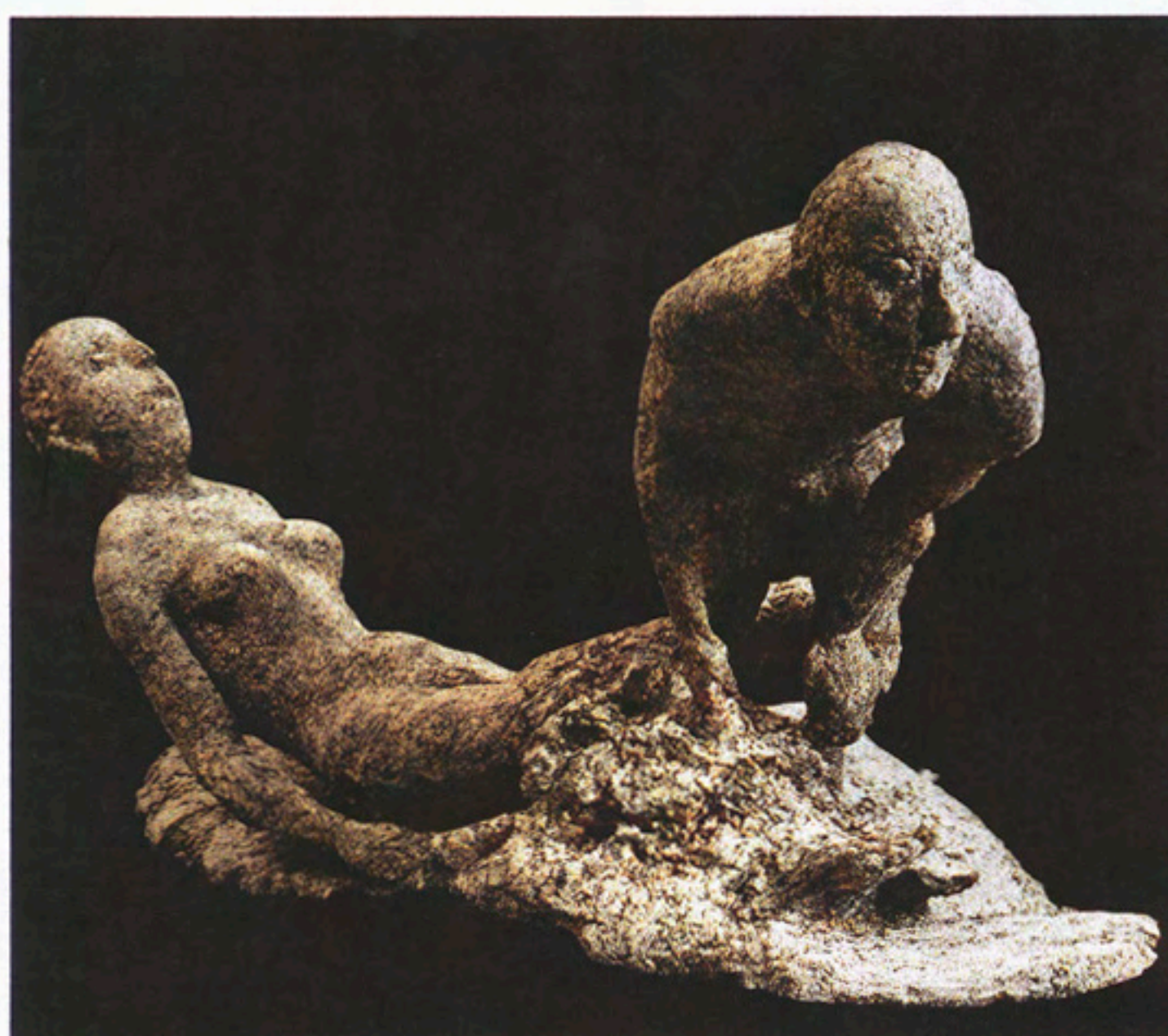
Ухожу. 1988. Керамика. 95x180x70

стым выражением личного и одновременно общечеловеческого опыта являются композиции, посвящённые отношениям между мужчиной и женщиной с ярко выраженным эротическим содержанием: «Двое», «Сладость дождя и облаков», «Влюблённые», «Ухожу». Любопытна в этом смысле автобиографическая скульптура «19-й выпуск Сурх-Дигорской средней школы», посвящённая однокурсникам. Это сложная композиция, в которой друзья художника выделены в «картину» «Удачные ученики». Наиболее традиционны портреты Соскиева и его монументы. Среди них такие замечательные проекты, как памятники Иосифу Бродскому, Булату Окуджава и, к счастью, реализованный памятник Марине Цветаевой в Тарусе (2006), замечательным образом вписывающийся в красивый русский ландшафт. Фигура поэтессы — наиболее академическая работа художника, но, тем не менее, сохраняет присущую мастеру жизненность формы.