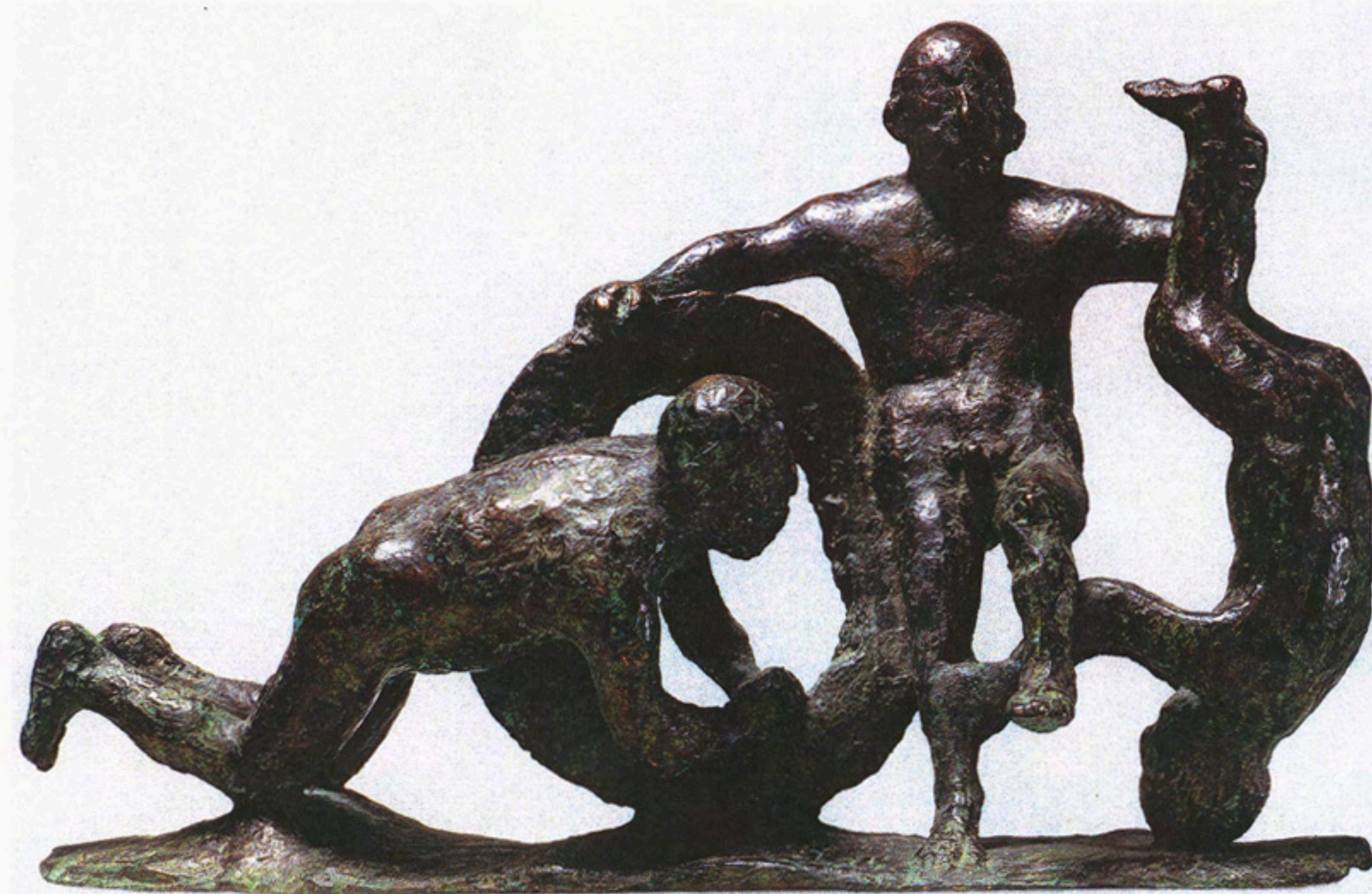
Царь. 1991. Бронза. 50x32x20