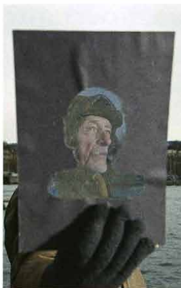
ПРОГУЛКА ПО ЦЮРИХУ. ПОРТРЕТ. 2010