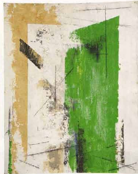
ИЗ СЕРИИ «ТАБУРЕТКА», ТЕМПЕРА НА КАРТОНЕ, 99×79, 2004