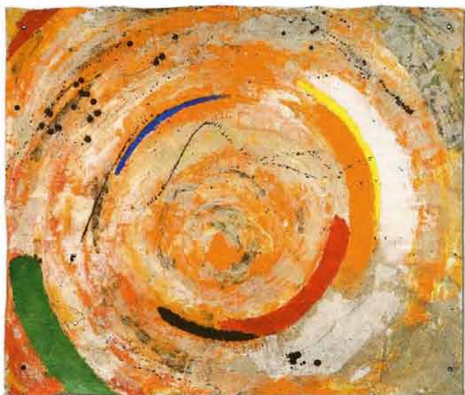
БЕЗ НАЗВАНИЯ, КАРАНДАШ НА ГРУНТОВАННОЙ БУМАГЕ, 69×62, 1996