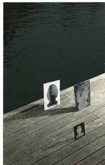
ПРОГУЛКА ПО ЦЮРИХУ, НА БЕРЕГУ РЕКИ ЛИММАТ №1, 2010

— А слова «участь», «соучастие» вы тоже не любите?