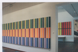
«Звук и линия звука», 2010 год.