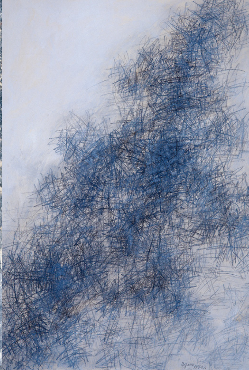
Igor Vulkoh, Winterlandschaft, Mischtechnik auf Papier, 85x55cm, 1970