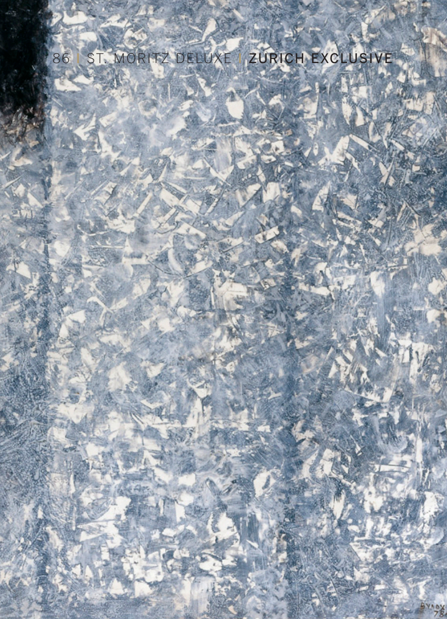
Igor Vulkoh, Winter, Mischtechnik auf Papier, 80x60cm, 1978